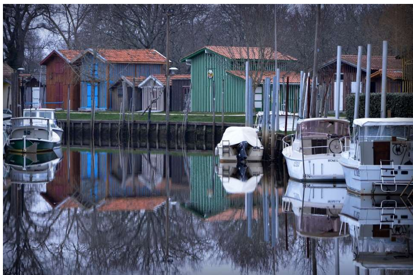
Port de Biganos

Organisée par le Photo-Club du Val de l'Eyre à Biganos (33) pour la Fédération Photographique de France, cette compétition aura lieu du vendredi 13 février au dimanche 15 février 2026.